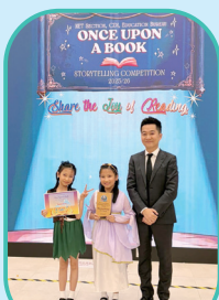
Once Upon A Book Storytelling Competition (Second Prize)