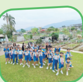
三年級學生到生活農莊體驗