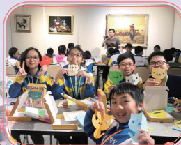
上海工藝美術館 (參觀及 剪紙工作坊)