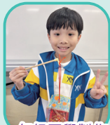
一年級同學製作了立體圖形燈籠

各級在常識或科學科課堂會進行以設計循環方式製作與課題有關的 STEAM 科創作品，讓學生透過「動手做」設計解決生活問題成品。低年級以驗證式解難製作成品，學生根據教師提供的步驟和材料製作成品，進行公平測試實驗，驗證當中的科學原理。一年級配合「走進大埔」跨課程主題參觀，以新年為主題，製成具個人特色的立體圖形燈籠。高年級以有序式解難製作成品，教師以設計循環設計活動並提出問題，讓學生搜集資料和材料，自己設計成品，進行對照實驗比較不同設計的好處，再進行改良。四年級利用課題所學相關科學知識，並進行跨課程研習，配合人文科專題研習—健康小衛士，學生就著他們所想建立的健康生活習慣，利用 micro:bit 製作法寶大發明。