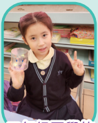
三年級同學的圖案燈罩