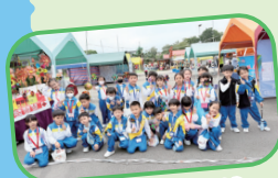
一年級學生到大埔林村新春市集

校本特色跨科課程以「走進大埔」為主題，將大埔社區轉化為「無牆教室」，讓學生透過實地考察，將課本知識與真實場域連結，打破學科壁壘，培養跨領域視野，進而深化理解及提升學習動機。