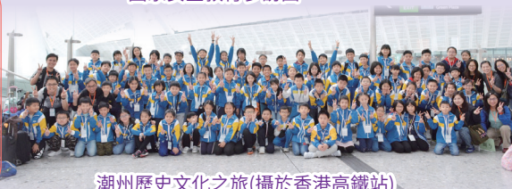
潮州歷史文化之旅(攝於香港高鐵站)