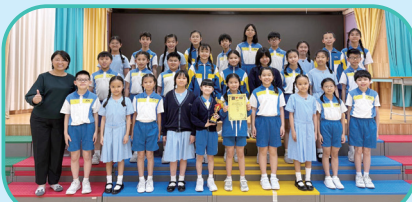
2026香港學界音樂大賽-小學合唱組(冠軍)