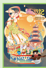
學生的視藝捏塑泥膠作品及電腦 Canva 海報作品