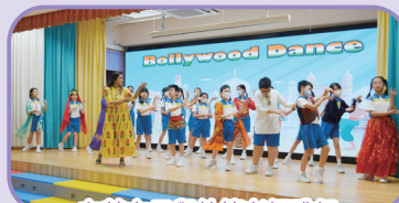
在英文日與外籍老師跳舞