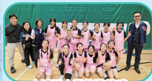
大埔區小學校際籃球 比賽(亞軍)