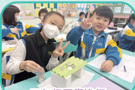
三年級同學進行紙橋測試