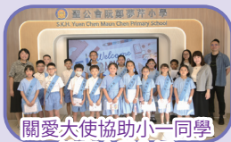
關愛大使協助小一同學適應小學生活