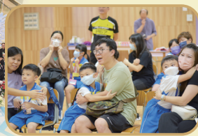
家長和學生一起參加 福音活動