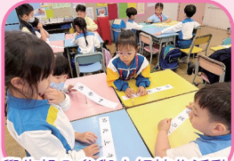
學生投入參與小組協作活動，並勇於展示及匯報學習成果