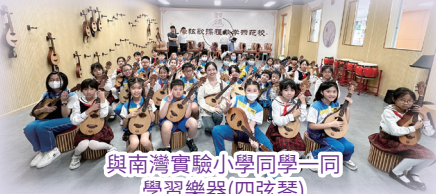
與南灣實驗小學同學一同 學習樂器(四弦琴)