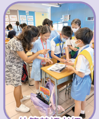
外籍英語老師上英文課