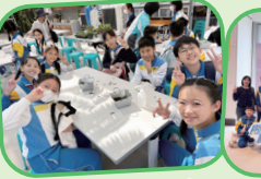
五年級學生到嘉道理農場進行植物種植活動