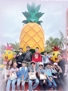
沖繩名護鳳梨園 到訪留念