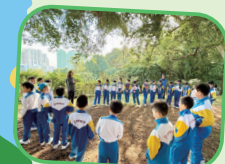
四年級學生在綠匯學苑認識綠色建築