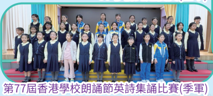
第77屆香港學校朗誦節英詩集誦比賽(季軍)