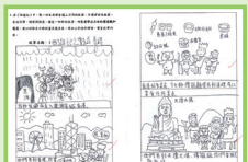
學生的《西遊記》-中文閱後創作工作紙

本校推行以中國經典名著為題的跨課程閱讀計劃。三年級以《西遊記》主題在各科進行不同學習任務，同學通過閱讀中英文版《西遊記》，先了解故事內容，其後會捏塑泥膠製作《西遊記》人物角色的造型，並利用 Canva 製作海報，另外以《一枝竹》一曲進行舊曲新詞創作，學習各角色有關團結及堅毅等價值觀態度。四年級以《三國演義》主題在各科進行不同學習任務，同學通過閱讀中英文版《三國演義》，認識人物性格特徵，並於相關課業如欣賞角色人物的性格工作紙。其後視藝科利用 SKETCHBOOK 應用程式描繪人物形象，然後製作簡報介紹自己欣賞的人物。