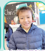
五年級同學製作的隔音護耳罩