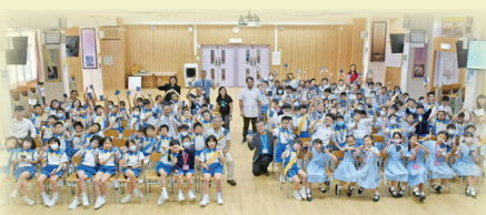
國際基甸會贈送聖經給四年級同學