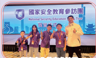
國家安全教育參訪團