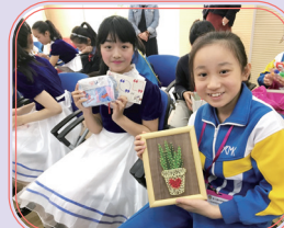
到訪上海閔行區花園小學