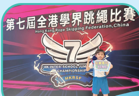
第七屆全港學界跳繩比賽 30秒前繩速度賽(亞軍)