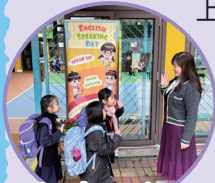
Good morning, Teacher! 戲向同學推廣價值觀教育，提供各種機會讓同學多說英語。

本校共有三位外籍英語老師，分別任教低年級「Space Town Literacy Programme」及高年級校本英語課程。為了鼓勵同學多以英語溝通，本校設定逢星期三為英語日，早上由當值老師以英語與同學打招呼，並由英文老師負責當天英語早禱，午膳時唱英語謝飯歌及唸英語禱文，提升校園英語氛圍。本校鼓勵同學在課堂內外多用英語，本科推行「Shall We Talk」獎勵計劃，同學收集蓋印後可換取 E-Tickets，然後在 E-Shop 向英語大使換取禮物。每月更會舉行英語午息活動，由外籍英語老師、家長義工及英語大使透過有趣遊