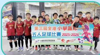
第三屆全港小學區際五人 足球比賽(亞軍)