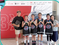
「2025大公盃三人 籃球賽」(亞軍)