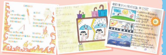
結合中文及視藝科，學生運用不同的修辭手法如擬人法、比喻等進行童詩創作。