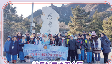
於長城居庸關合照