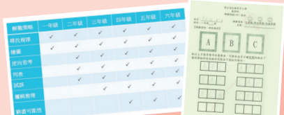
透過校本的解難課程，讓學生運用不同的解難策略，如尋找規律、繪圖、逆向思維等進行解題，以提升學生的高階思維能力。