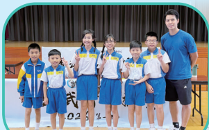
2026香港武術錦標賽(第一站)- 集體五步拳(冠軍)