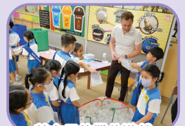
英文日的攤位遊戲真有趣