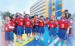
幼兒手球比賽(季軍)