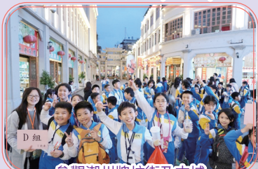
參觀潮州牌坊街及古城