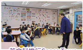
英文科推行Space Town Literacy Programme，透過學習英語拼音、遊戲、故事閱讀及寫作訓練等，提升學生的英語能力。

讓學生透過編程技巧，培養計算思維的能力，並將編程技巧應用到不同的情境，以完成設定的任務或工作。