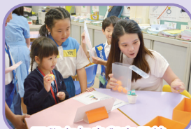
同學在午息與家長義工玩遊戲