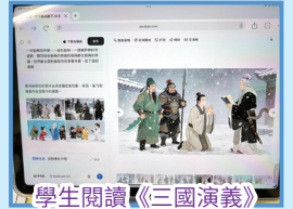
學生閱讀《三國演義》後，以人工智能生成「三顧草廬」或「桃園結義」的圖片

能應用於寫作教學及延伸課業上，讓學生按課題所學，給予 Gemini 相關和充足的提示字詞，生成 Posters、Leaflets 或四格漫畫，大大提高他們學習效能和興趣。