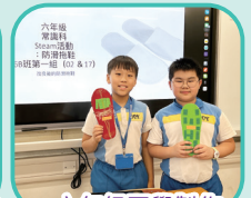
六年級同學製作的防滑拖鞋