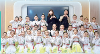
屯門區第四十屆舞蹈大賽(銅獎)