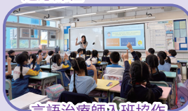
言語治療師入班協作