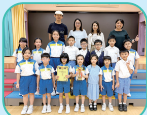
2026香港學界音樂大賽 (口琴)(冠軍)

學生除了在學業上有優良的表現外，在其他的範疇上也有驕人的成績，無論是運動、音樂、視藝或編程等比賽活動，他們都獲獎無數，得到外界的認同和讚賞。