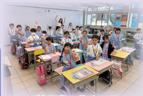
於開學日為小一及插班生送上禮物包