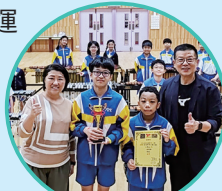
2026香港學界音樂 大賽(亞軍)