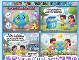
學習 Save Our Earth 課題後，學生應用人工智能創作四格漫畫向同學宣傳保護環境的重要