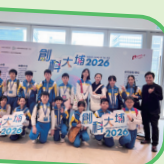
六年級學生到創科@大埔參觀