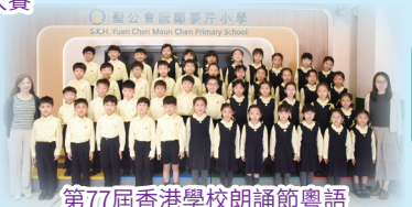
第77屆香港學校朗誦節粵語 詩文集誦比賽(冠軍)