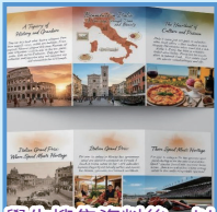
學生搜集資料後，以 Gemini 生成小冊子

本校積極推動電子學習及數字教育，利用不同的網上學習平台，如「中文科階梯閱讀空間」、「英文科校本練習」、「Epic」、「數學科診斷評估」等，為學生提供多元化的學習資源，亦透過 Google Classroom 提供各科學習資源，讓學生在課餘時間仍能自學及促進師生的學習交流，更能培養自主學習的能力和習慣。此外，本校在四年級起推行自攜裝置 (BYOD) 計劃，讓學生更靈活運用學習資源，提升學與教的效能和學習興趣。