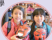
山西人民藝術之旅