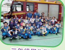
二年級學生到大埔及大埔東消防局參觀