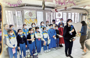
透過團契活動，同學能服務 社區，關懷送暖