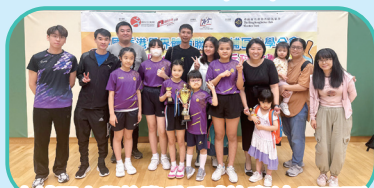
大埔區小學校際乒乓球比賽(女團亞軍)