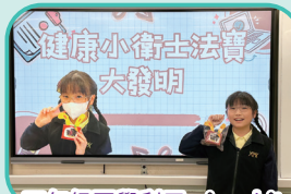
四年級同學利用 micro:bit 製作健康法寶大發明