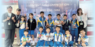
MakeX機械人挑戰賽總決賽(香港)- 全港小學組(全場總亞軍)