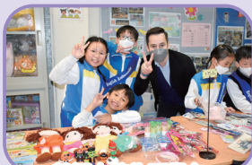
英語大使為同學在 E-Shop 換取禮物